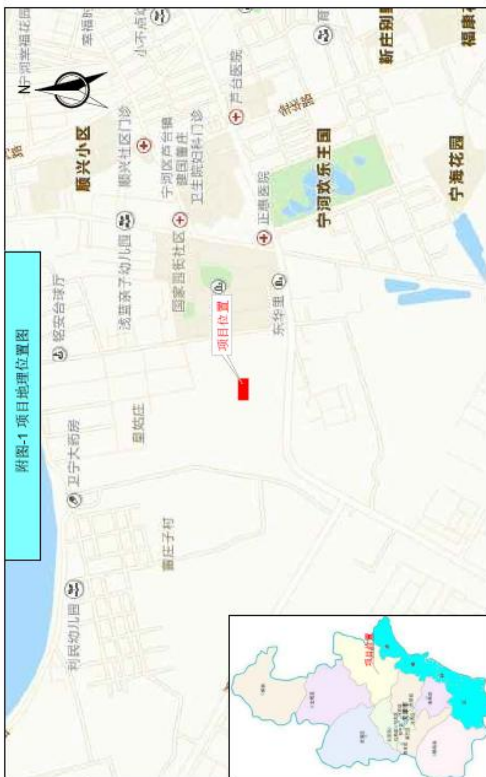
附图 1. 项目区地理位置图